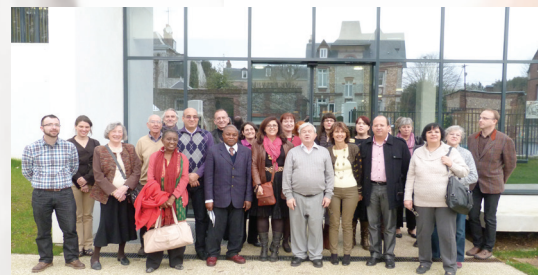
PHOTO : Les participants au colloque 2012 au Musée de l'Éducation à Rouen

Maison des Sciences de l'Homme Paris Nord